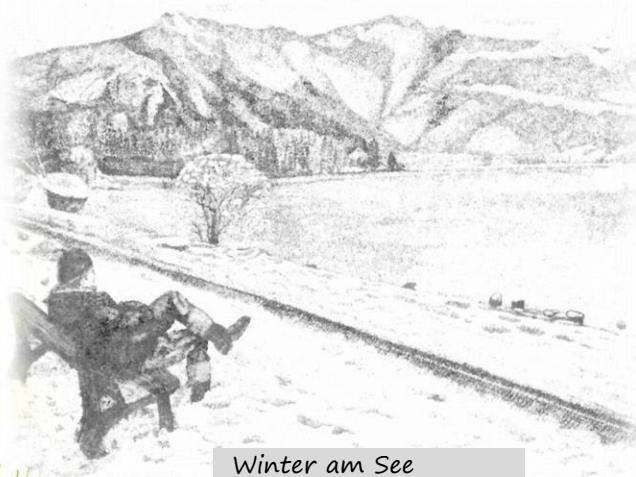
Winter am See - von Karl-Heinz Borsch