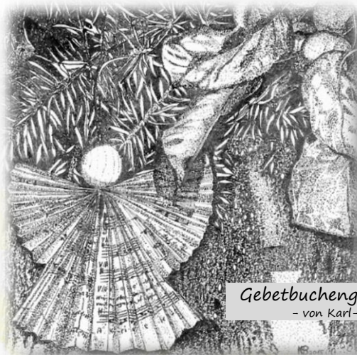
Gebetbuchengel - von Karl-Heinz Borsch

Herzliche Grüße Ihre und Eure St. Sebastianus-Schützenbruderschaft - Der Vorstand -