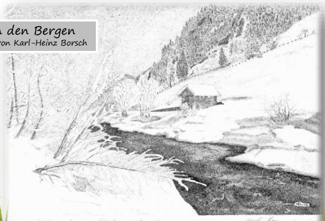
Winter in den Bergen - von Karl-Heinz Borsch

Ihre und Eure St. Sebastianus-Schützenbruderschaft - Der Vorstand -